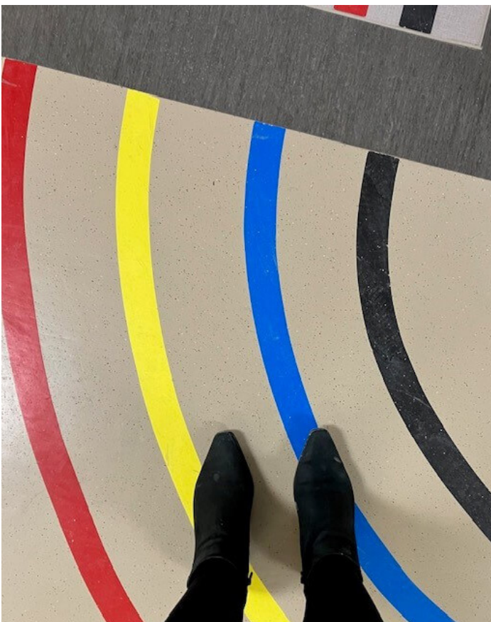
L'ancien système d'orientation au sol de l'Hôpital Saint-Boniface.

La première phase de ce grand projet se concentre sur le rez-de-chaussée et le premier étage, là où la plupart des rendez-vous ont lieu. Courant juin 2023, les plans et dessins finaux devaient être complétés et dévoilés à l'ensemble du personnel. L'installation des nouveaux panneaux devrait commencer dans la seconde moitié de 2023, d'abord aux niveaux de l'atrium, des couloirs, des ascenseurs, des escaliers et des tunnels qui relient l'hôpital avec l'Institut I.H. Asper et le centre McEwen.