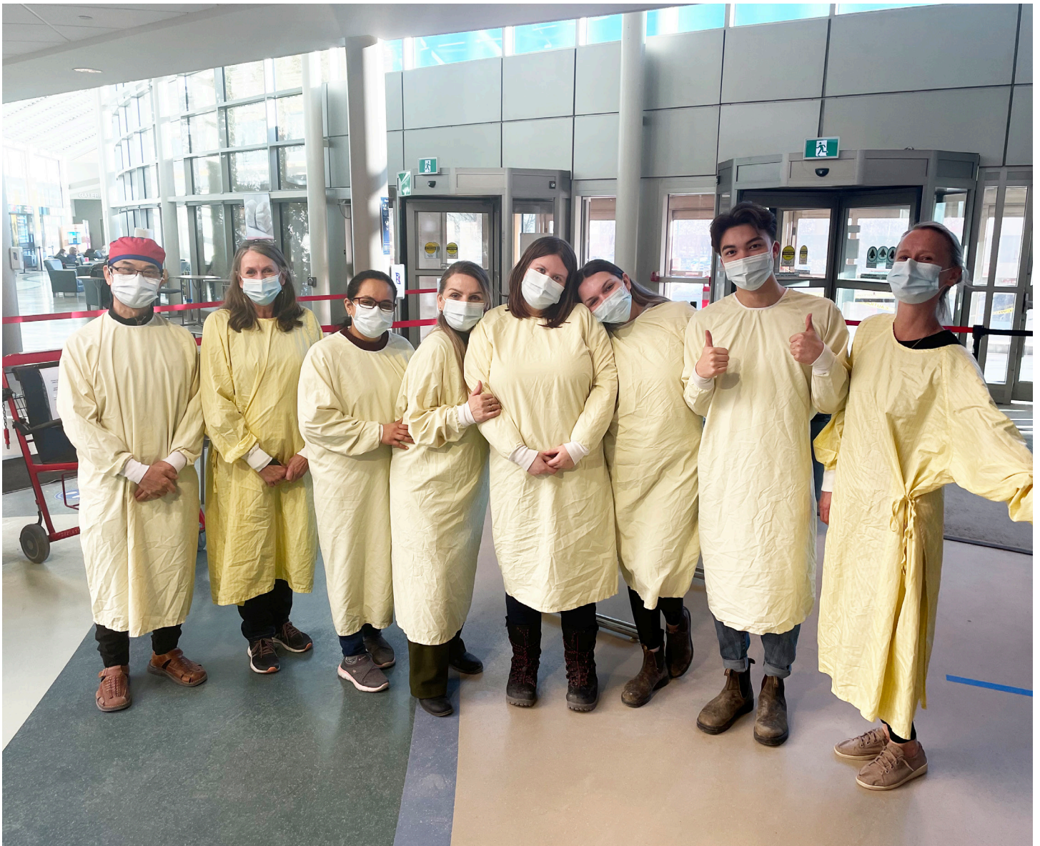
Quelques screeners de l'Hôpital Saint-Boniface lors de leur dernier jour, le 31 mars 2023.

D'ailleurs, pour certains, ce n'était qu'un au revoir. « Quelques anciens screeners sont aujourd'hui devenus bénévoles pour l'Hôpital Saint-Boniface, et une autre douzaine y a décroché des emplois, entre autres à la buanderie, au service de nettoyage, à la sécurité ou encore dans le service d'imagerie diagnostique », termine Jennifer Cawson.