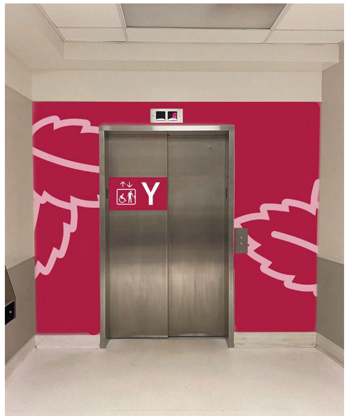
Un exemple du nouveau système d'orientation visuelle centralisé de l'Hôpital Saint-Boniface. L'installation devrait commencer vers la fin 2023.